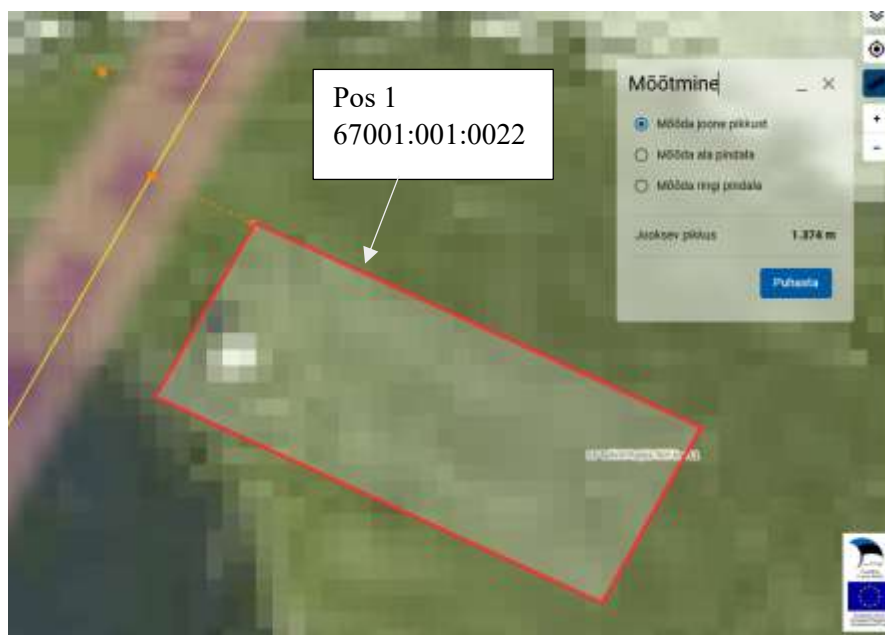
Joonis 2 IKÕ ala kaugus läänepoolsest krundi piirist 1,374m